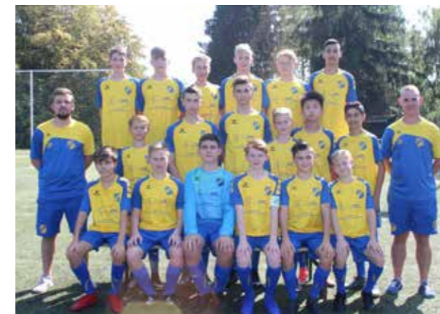
Wo Unterstützung sinnvoll ist, da helfen wir gerne! Wie z. B. bei den Fußballern des SV Fischbach 1912 e.V.

Wir alle müssen umdenken – BLEMO ist schon mittendrin.