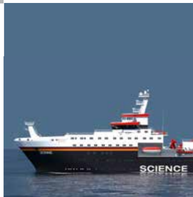
FORSCHUNG- SCHIFF „SONNE“