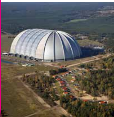
TROPICAL ISLAND, BERLIN