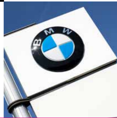
BMW AG, BERLIN